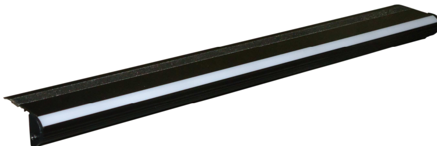
Figura 1 - Luminária LED para degrau

A empresa deverá fornecer ART/RRT de execução das instalações elétricas realizadas, devidamente quitada e termo de garantia de 24 meses dos equipamentos instalados.